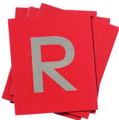
Teppichfliesen mit Buchstaben