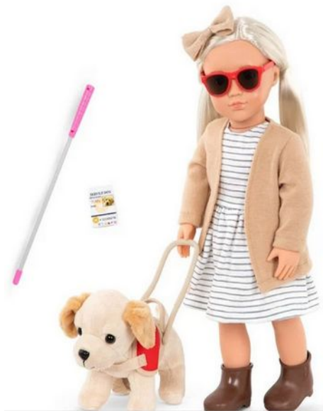
Puppe mit Blindenhund und Blindenstab

https://www.coolshop.de/produkt/our-generation-marlow-doll-with-pet-guide-dog-731321/2386FV/?gclid=EAlaIQobChMI4YWIhcPG-wIVQaHVCh1G4QYOEAQYBCABEgLOCfD_BwE&gclsrc=aw.ds