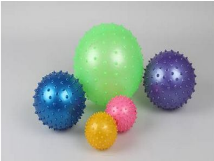
Stachelbälle in verschiedenen Größen