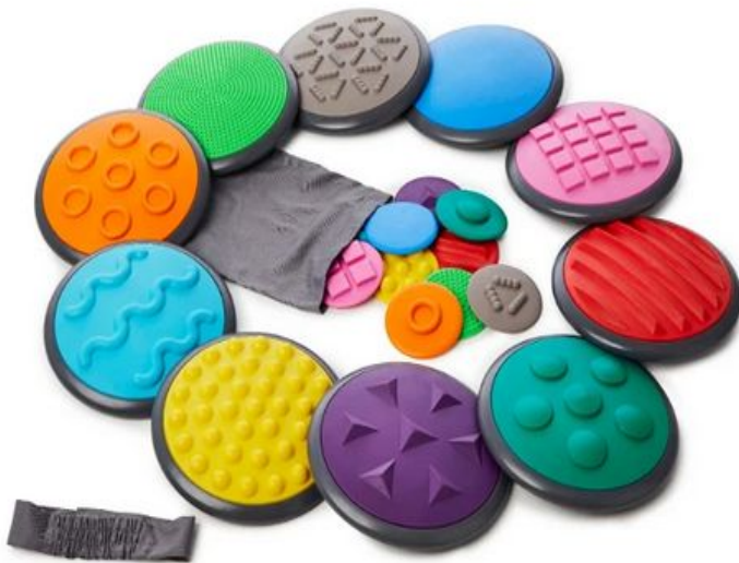
Taktile Scheiben fördern den Tastsinn der Hände und Füße