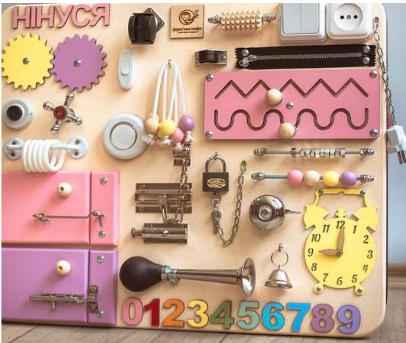
Ein Wandbrett mit vielen taktilen Anregungen